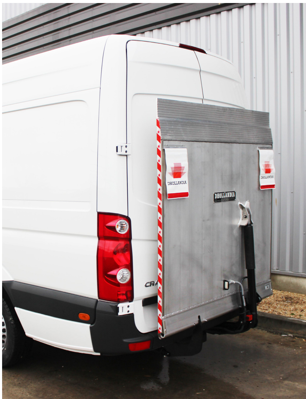
Hayon 500 kg DHLP avec plateforme de 1550 mm et arrêt de rolls